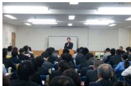
～過去のセミナーの様子～